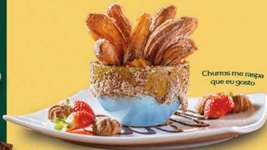
Churros me raspa que eu gosto