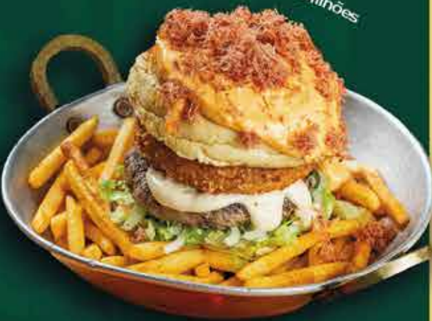
Burguer de Milhões