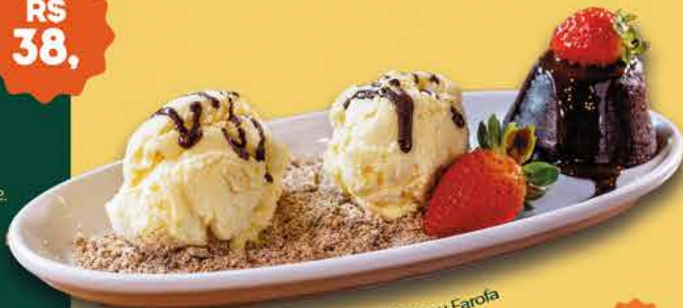
Peti Gateau Farofa

Bolinho cremoso por dentro, servido sobre uma camada da nossa farofa doce secreta e duas bolas de sorvete de creme com calda de chocolate.